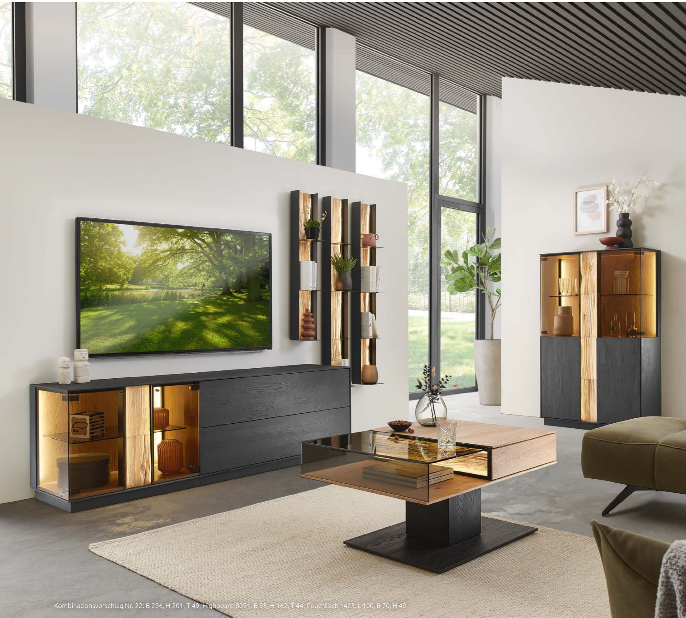
Kombinationsvorschlag Nr. 22: B 296, H 201, T 49, Highboard 8091: B 98, H 162, T 44, Couchtisch 1423: L 100, B 70, H 49