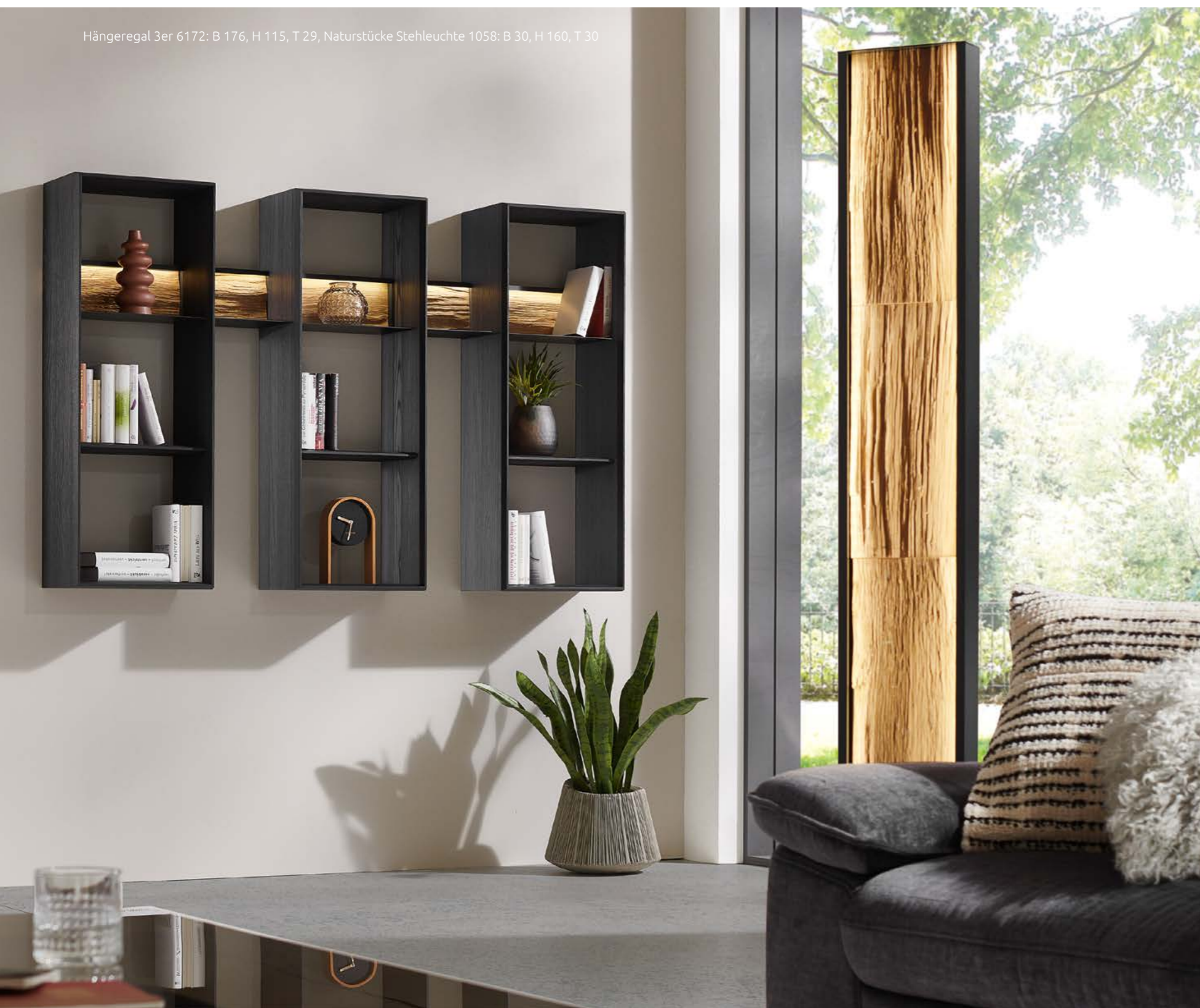
Hängeregal 3er 6172: B 176, H 115, T 29, Naturstücke Stehleuchte 1058: B 30, H 160, T 30