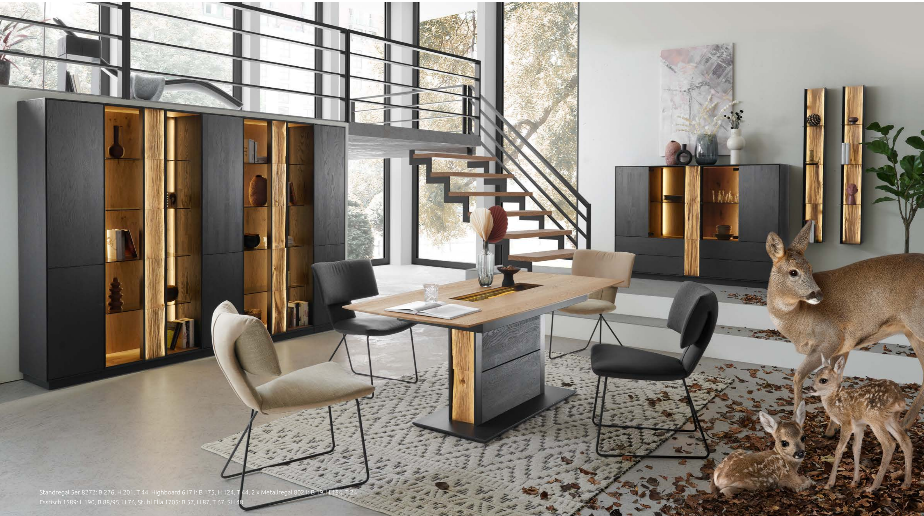
Standregal 5er 8272: B 276, H 201, T 44, Highboard 6171: B 175, H 124, T 44, 2 x Metallregal 8021: B 19, H 154, T 24 Esstisch 1589: L 190, B 88/95, H 76, Stuhl Ella 1705: B 57, H 87, T 67, SH 48