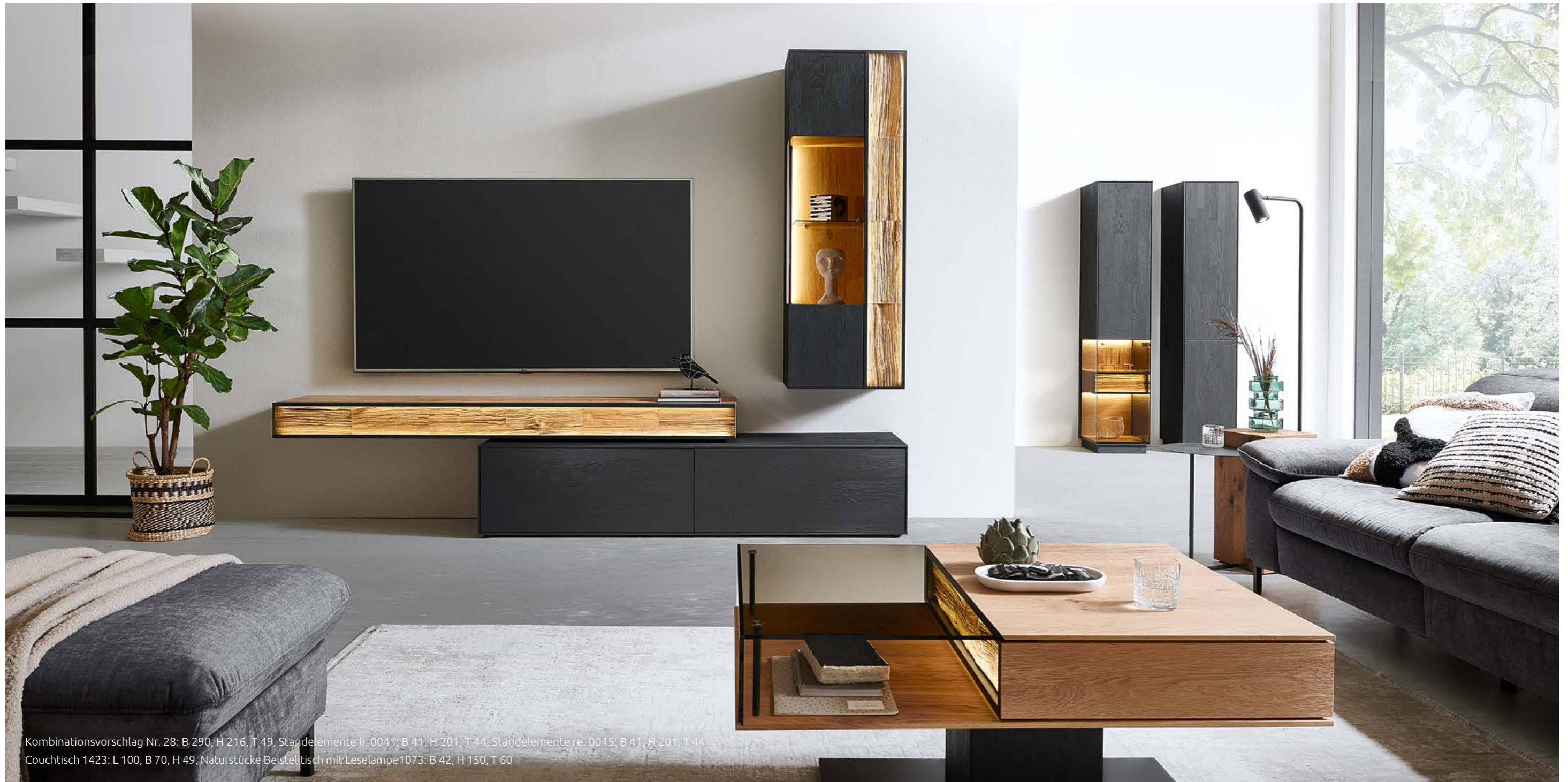
Kombinationsvorschlag Nr. 28: B 290, H 216, T 49. Standelemente li. 0041: B 41, H 201, T 44, Standelemente re. 0045: B 41, H 201, T 44 Couchtisch 1423: L 100, B 70, H 49, Naturstücke Beistelltisch mit Leselampe 1073: B 42, H 150, T 60