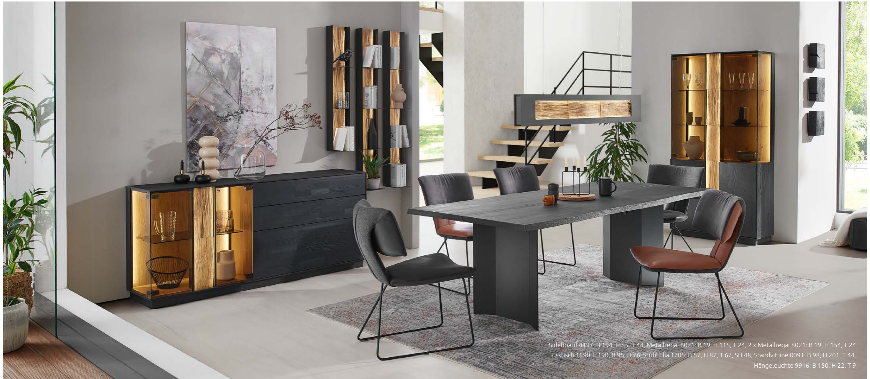
Sideboard 4197: B 194, H 85, T 44, Metallregal 6021: B 19, H 115, T 24, 2 x Metallregal 8021: B 19, H 154, T 24 Esstisch 1590: L 190, B 95, H 76, Stuhl Ella 1705: B 57, H 87, T 67, SH 48, Standvitrine 0091: B 98, H 201, T 44, Hängeleuchte 9916: B 150, H 22, T 9