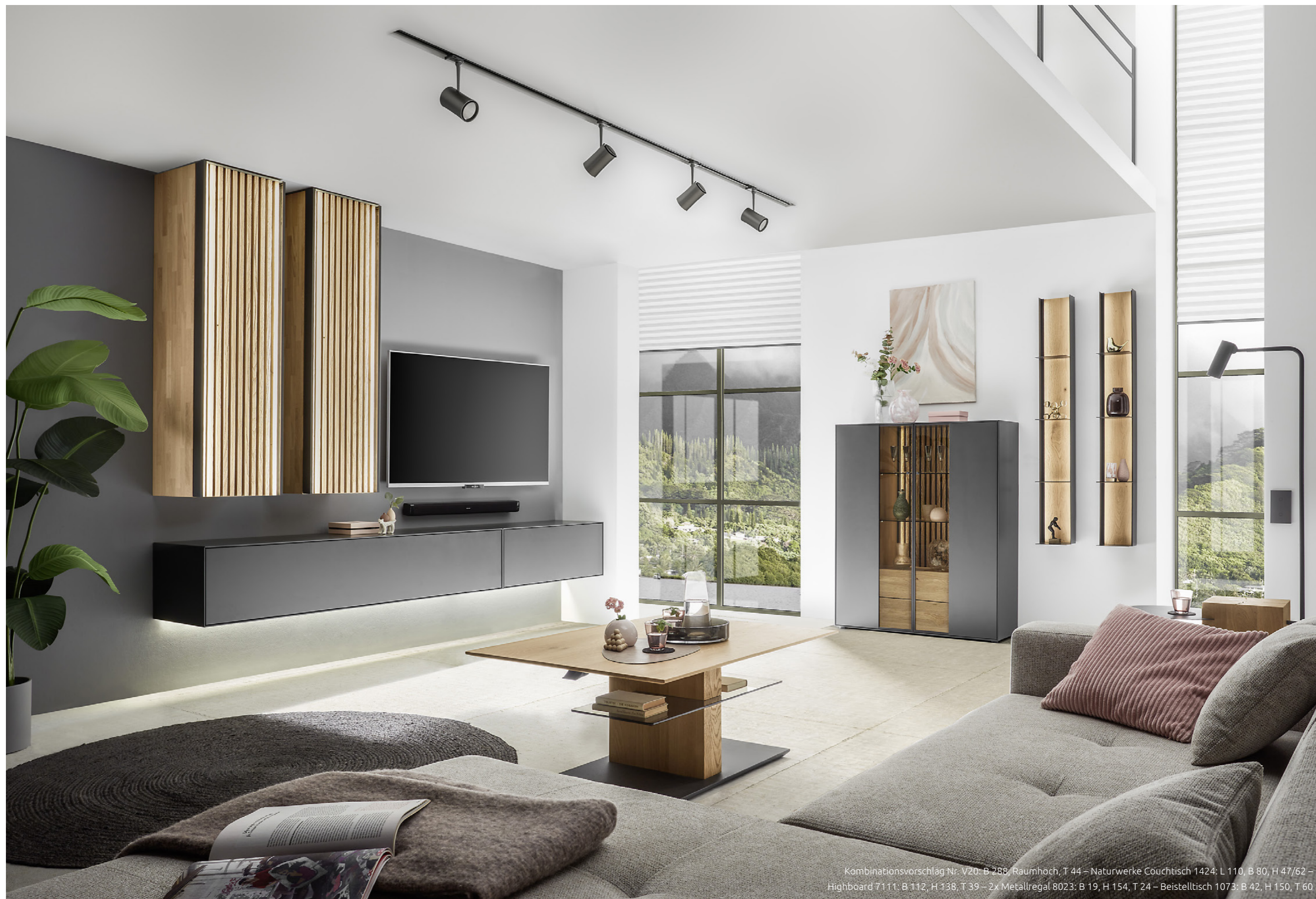
Kombinationsvorschlag Nr. V20: B 288, Raumhoch, T 44 – Naturwerke Couchtisch 1424: L 110, B 80, H 47/62 – Highboard 7111: B 112, H 138, T 39 – 2x Metallregal 8023: B 19, H 154, T 24 – Beistelltisch 1073: B 42, H 150, T 60