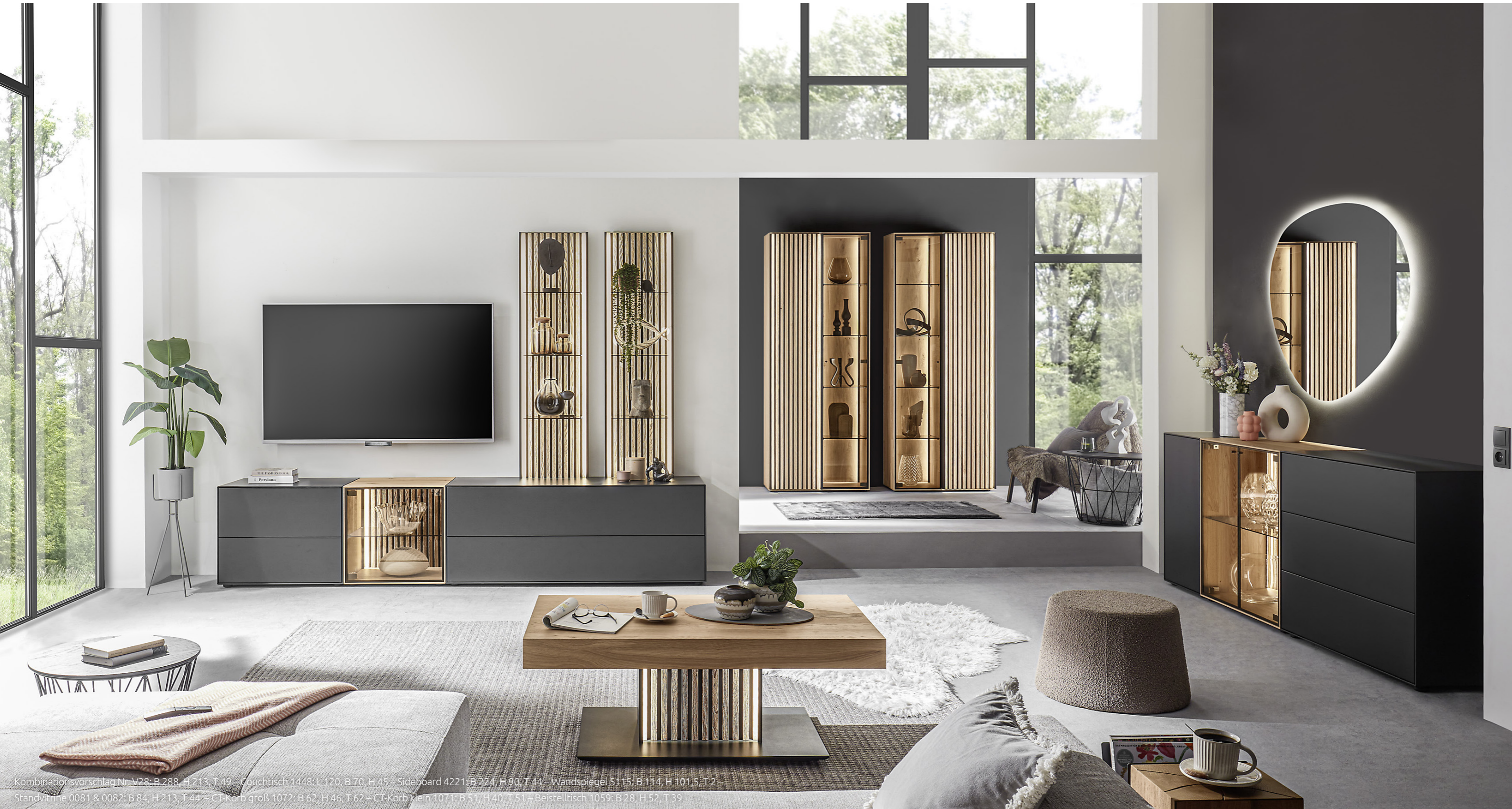
Kombinationsvorschlag Nr. V28: B 288, H 213, T 49 – Couchtisch 1448: L 120, B 70, H 45 – Sideboard 4221: B 224, H 90, T 44 – Wandspiegel 5115: B 114, H 101,5, T 2 – Standvitrine 0081 & 0082: B 84, H 213, T 44 – CT-Korb groß 1072: B 62, H 46, T 62 – CT-Korb klein 1071: B 51, H 40, T 51 – Beistelltisch 1059: B 28, H 52, T 39