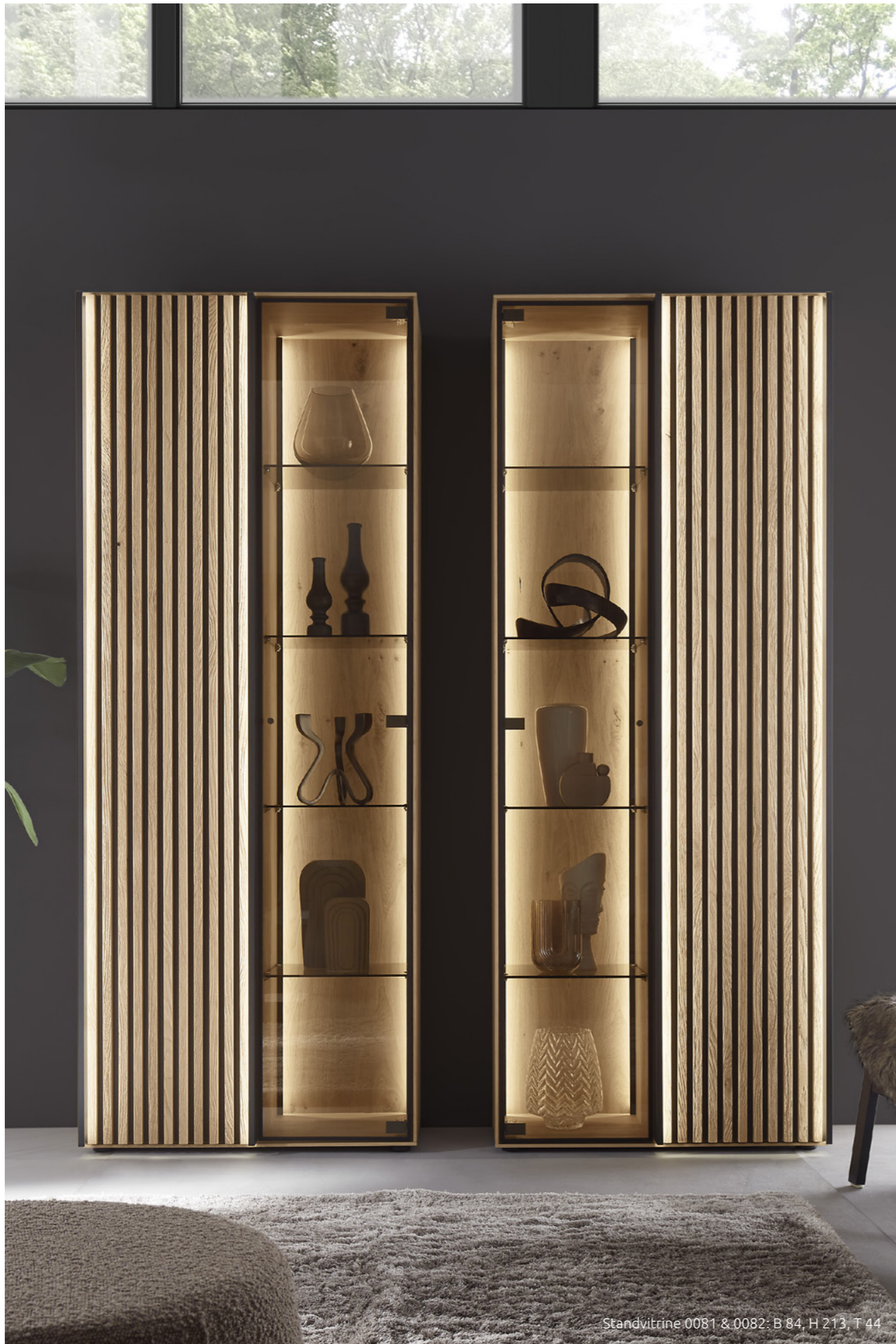
Standvitrine 0081 &amp; 0082: B 84, H 213, T 44