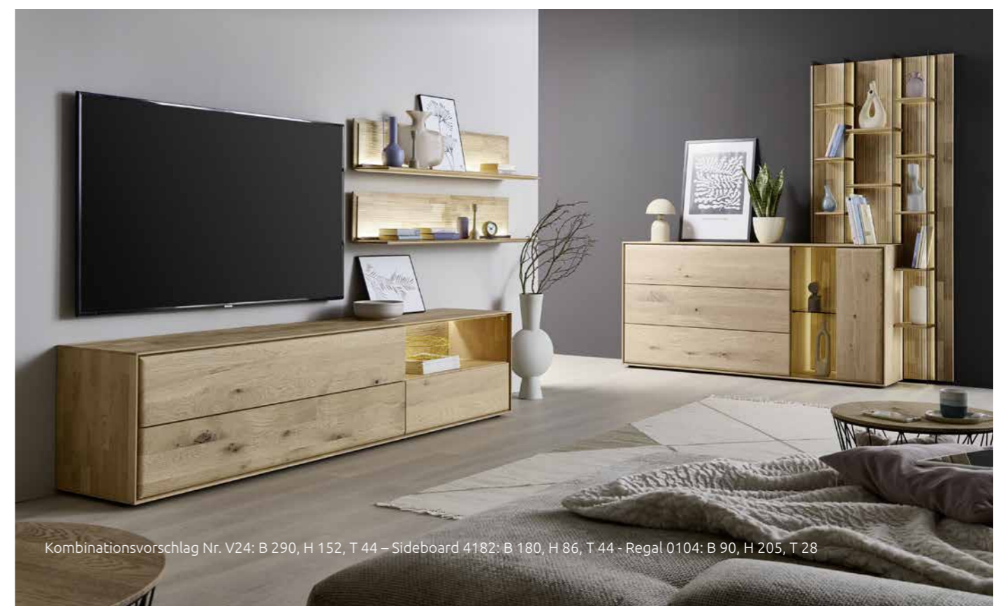
Kombinationsvorschlag Nr. V24: B 290, H 152, T 44 – Sideboard 4182: B 180, H 86, T 44 - Regal 0104: B 90, H 205, T 28

From the eye-catching niche in the sideboard through display cabinets and shelving to wall panels – every element can be fitted with energy-saving LED strips at your discretion. The warm glow of the subtle indirect lighting enhances the welcoming ambiance and gives your prized pieces a grand stage.