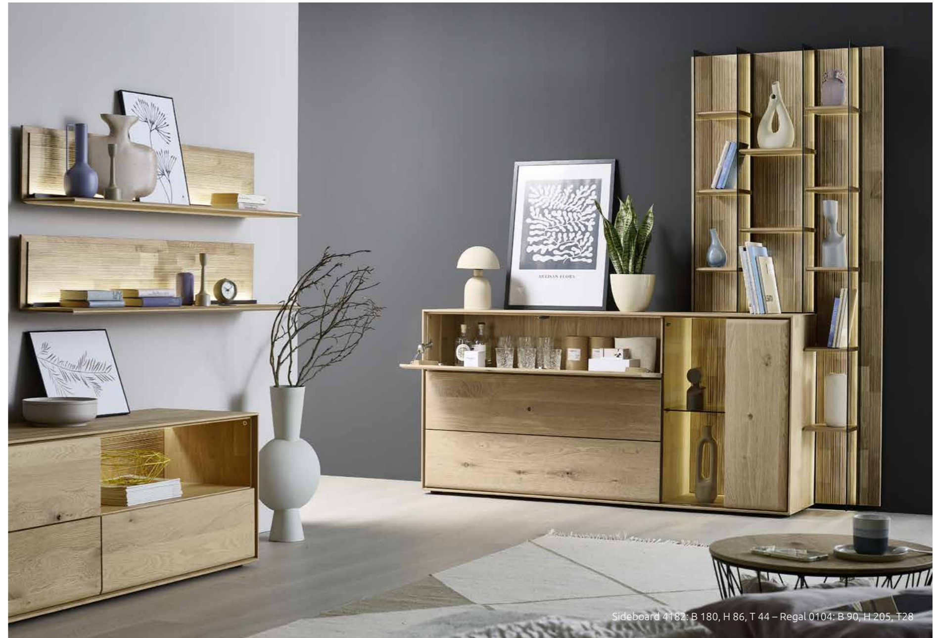
Sideboard 4182: B 180, H 86, T 44 – Regal 0104: B 90, H 205, T 28