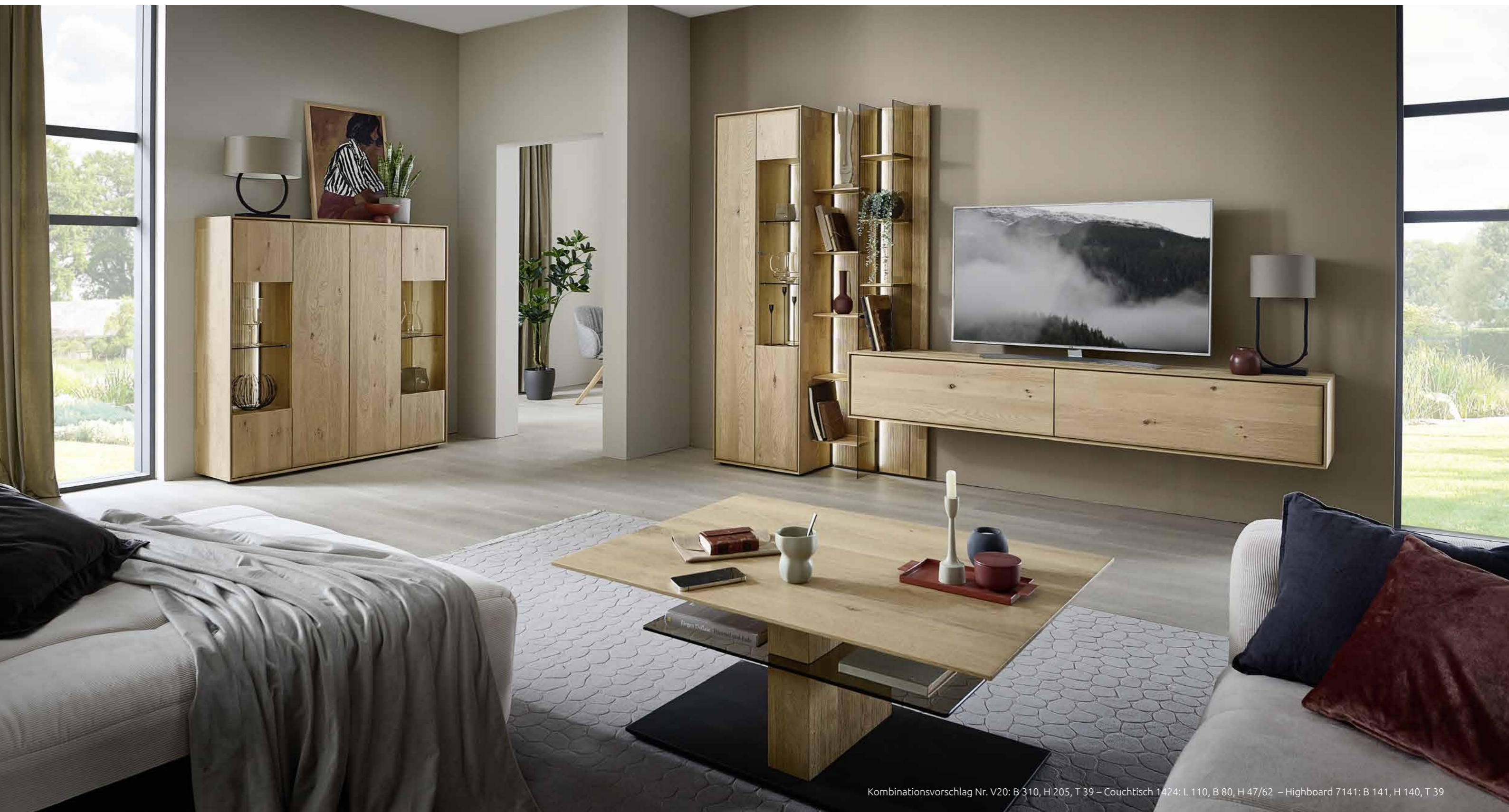
Kombinationsvorschlag Nr. V20: B 310, H 205, T 39 – Couchtisch 1424: L 110, B 80, H 47/62 – Highboard 7141: B 141, H 140, T 39