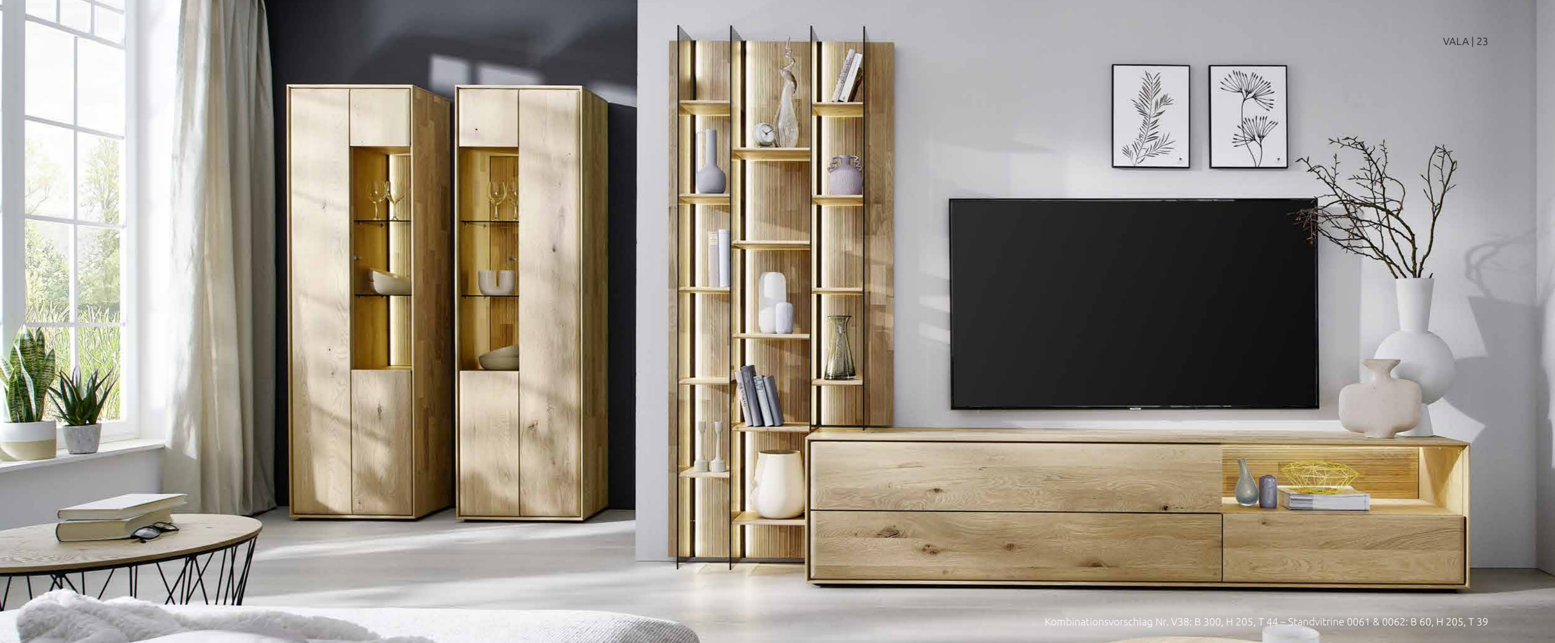
Kombinationsvorschlag Nr. V38: B 300, H 205, T 44 – Standvitrine 0061 &amp; 0062: B 60, H 205, T 39