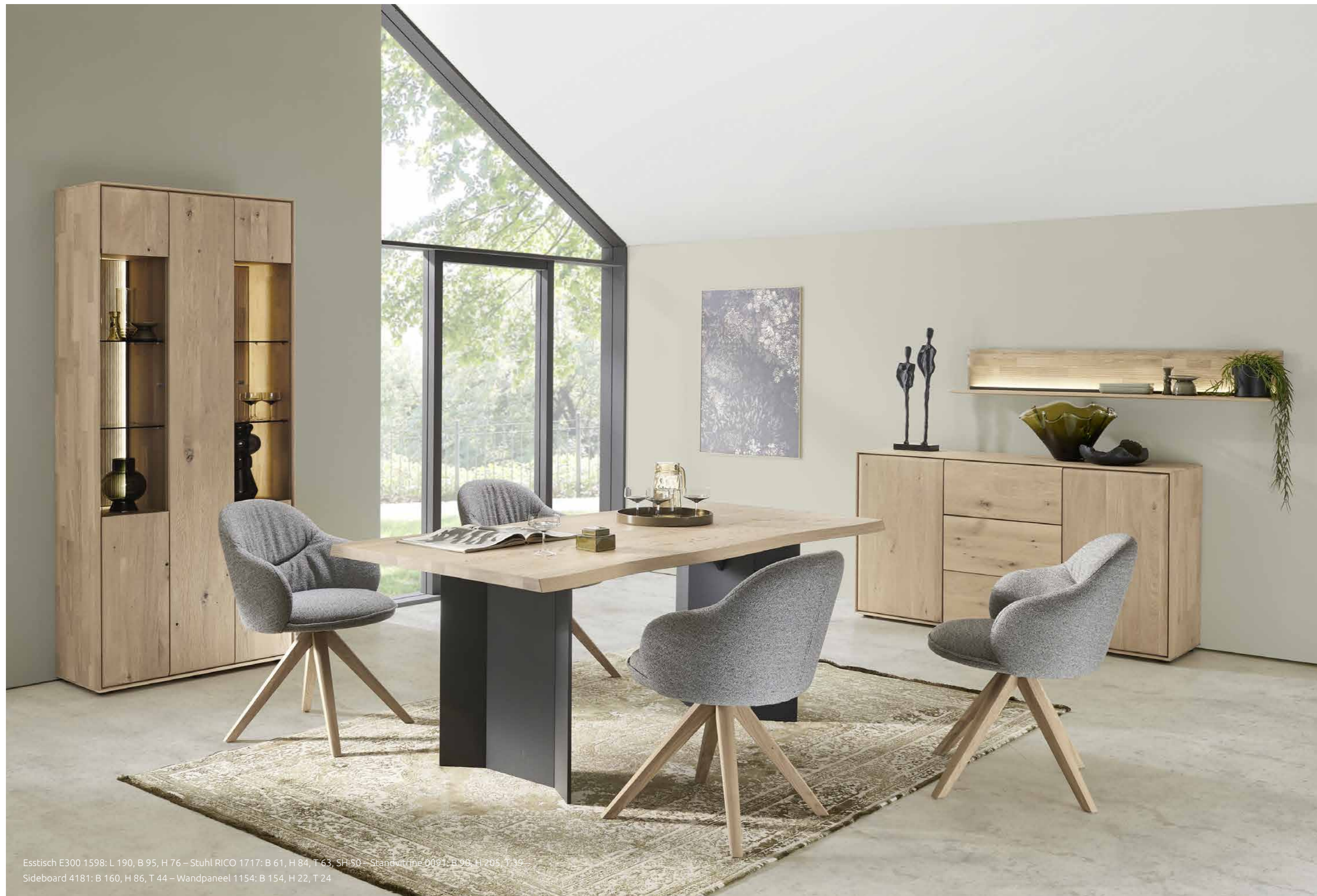
Esstisch E300 1598: L 190, B 95, H 76 – Stuhl RICO 1717: B 61, H 84, T 63, SH 50 – Standvitrine 0091: B 90, H 205, T 39 – Sideboard 4181: B 160, H 86, T 44 – Wandpaneel 1154: B 154, H 22, T 24