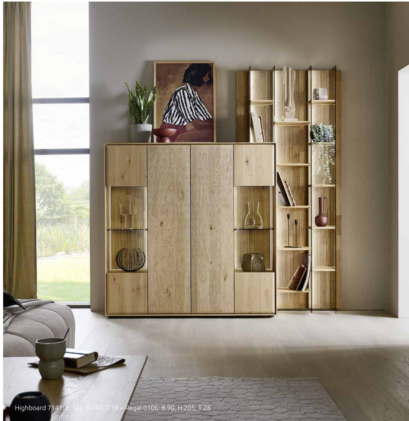
Highboard 7141: B 141, H 140, T 39 – Regal 0106: B 90, H 205, T 28