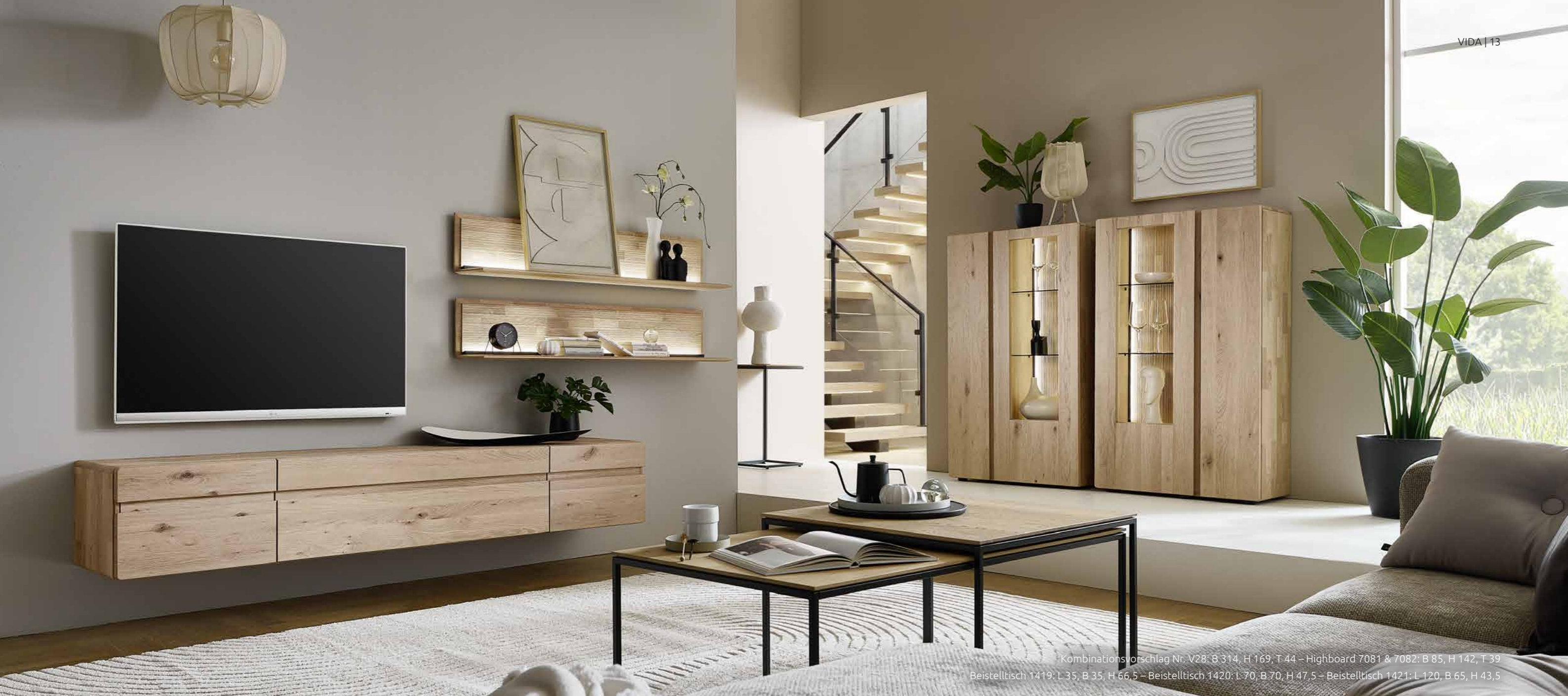
Kombinationsvorschlag Nr. V28: B 314, H 169, T 44 – Highboard 7081 & 7082: B 85, H 142, T 39 Beistelltisch 1419: L 35, B 35, H 66,5 – Beistelltisch 1420: L 70, B 70, H 47,5 – Beistelltisch 1421: L 120, B 65, H 43,5