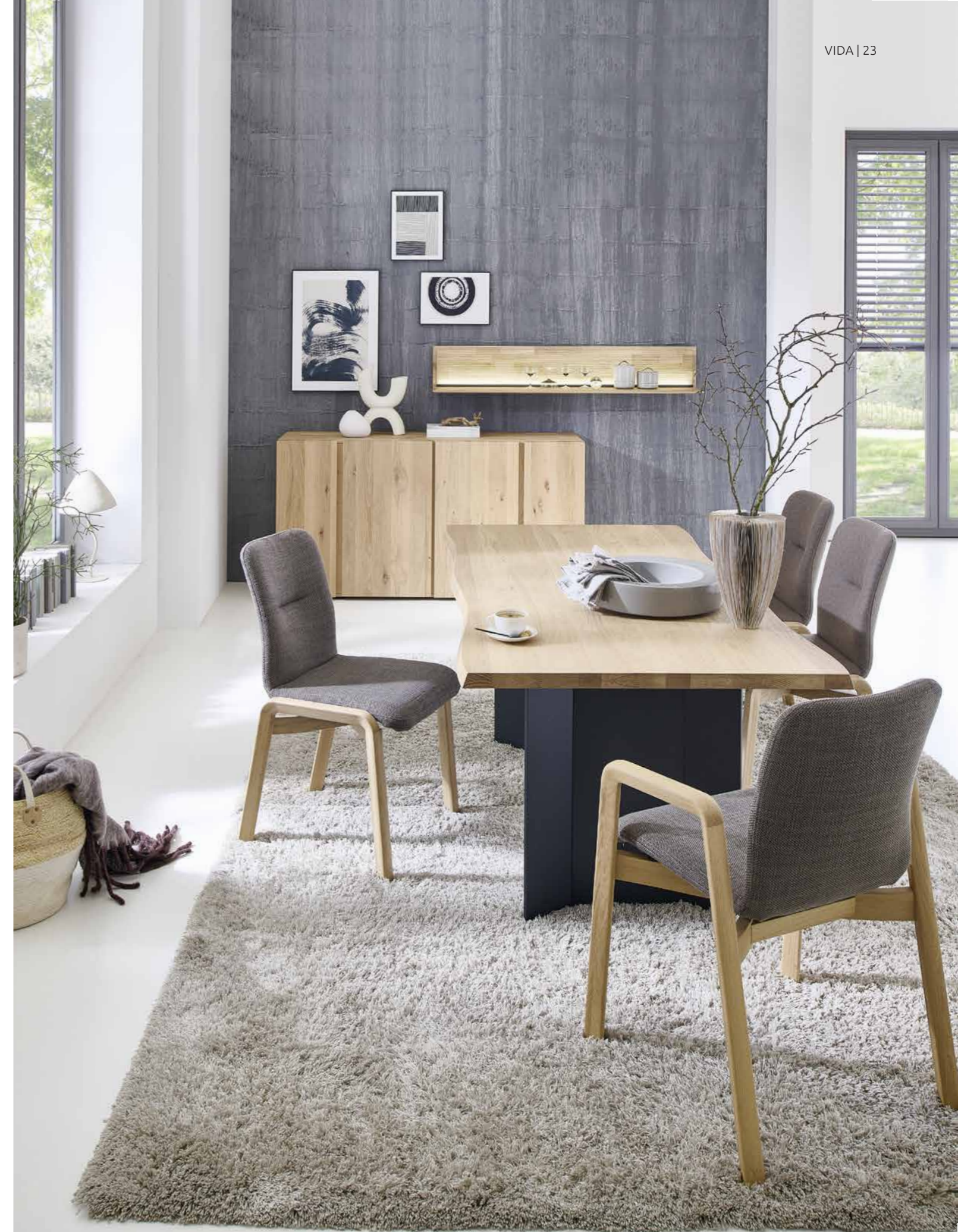
Esstisch E300 1598: L 190, B 95, H 76 – Stuhl NAAJA 1722 & 1378: B 56, H 89, T 60, SH 48 – Sideboard 5191: B 170, H 88, T 44 – Wandpaneel 1154: B 154, H 22, T 24

As visually striking as the sideboard is on the outside, it's equally spacious within. The offset side joints of our sideboard are not only an eye-catching design detail, but also serve as comfortable handles for the four front doors. Inside the cabinet, two wooden shelves provide the space your belongings need.