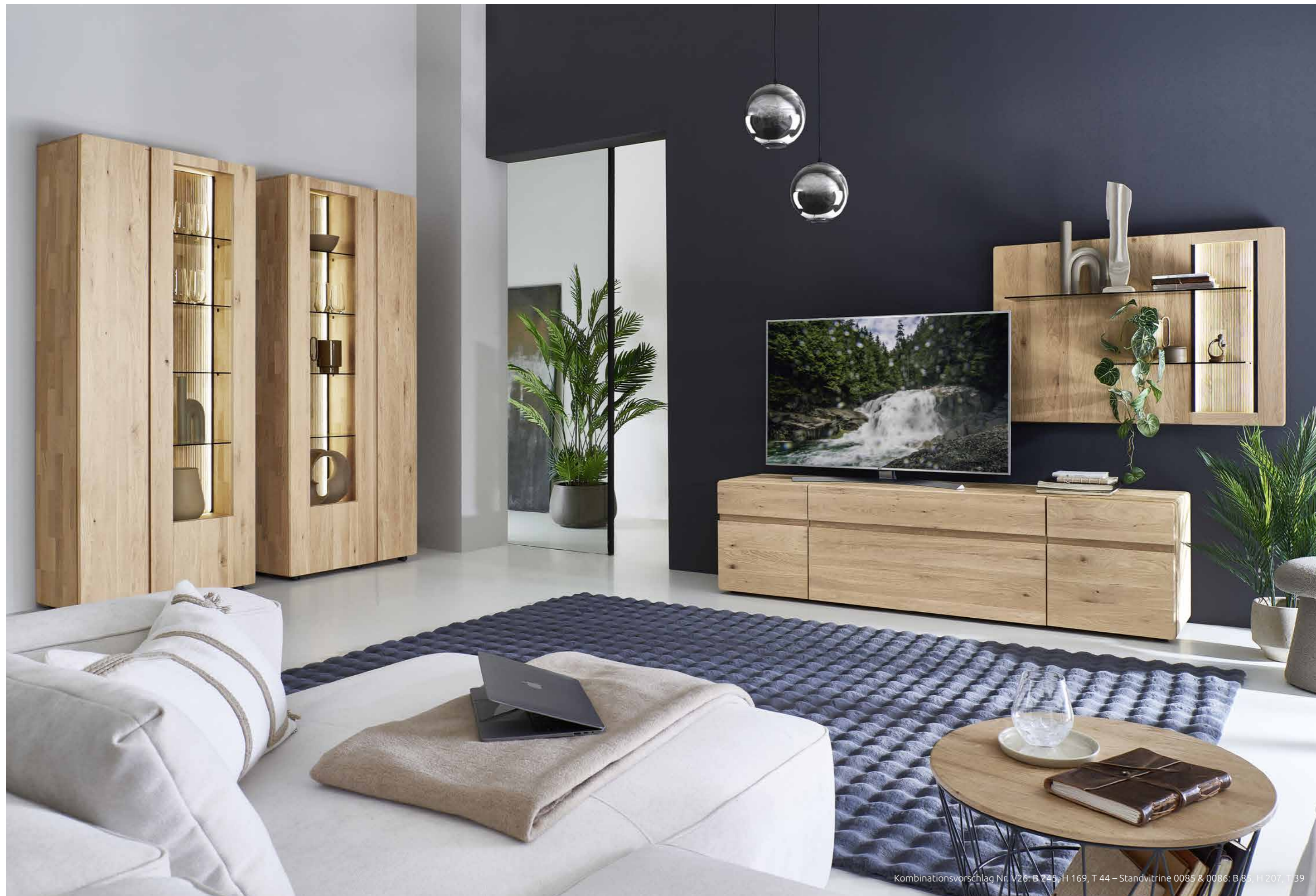
Kombinationsvorschlag Nr. V26: B 245, H 169, T 44 – Standvitrine 0085 & 0086: B 85, H 207, T 39