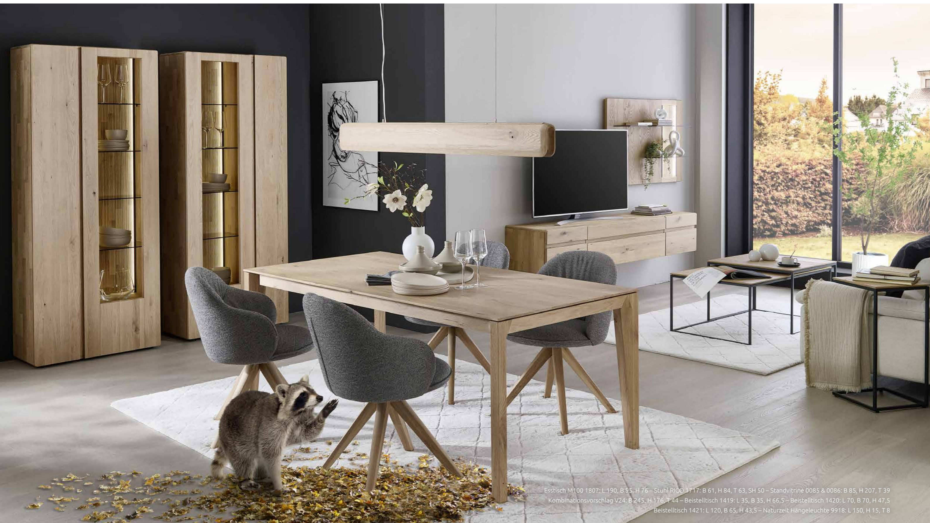
Esstisch M100 1807: L 190, B 95, H 76 – Stuhl RICO 1717: B 61, H 84, T 63, SH 50 – Standvitrine 0085 & 0086: B 85, H 207, T 39 Kombinationsvorschlag V24: B 245, H 176, T 44 – Beistelltisch 1419: L 35, B 35, H 66,5 – Beistelltisch 1420: L 70, B 70, H 47,5 Beistelltisch 1421: L 120, B 65, H 43,5 – Naturzeit Hängeleuchte 9918: L 150, H 15, T 8