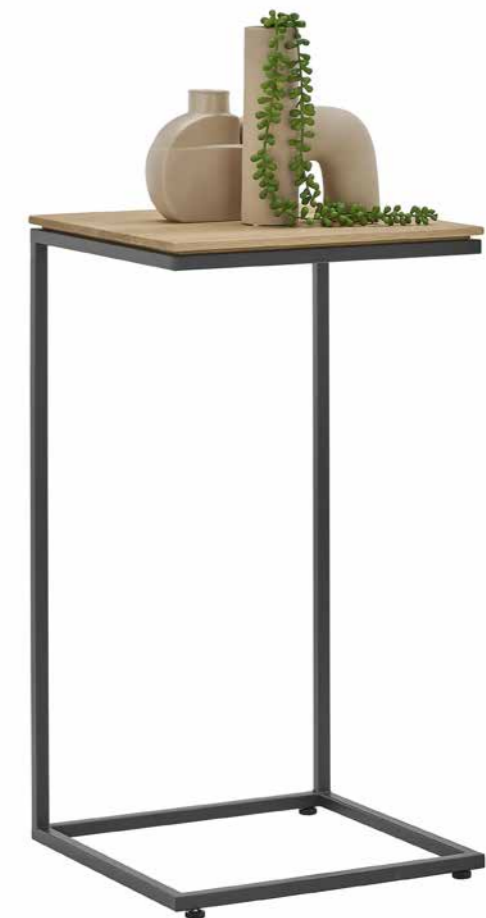
Beistelltisch 1419: L 35, B 35, H 66,5

The modular principle of the Vida program extends beyond cabinet bodies and panels: the three side tables with slender anthracite metal legs offer you equally versatile furnishing options for the heart of your living room. The side tables 1420 and 1421, for example, can be nested together, giving you even more design freedom.