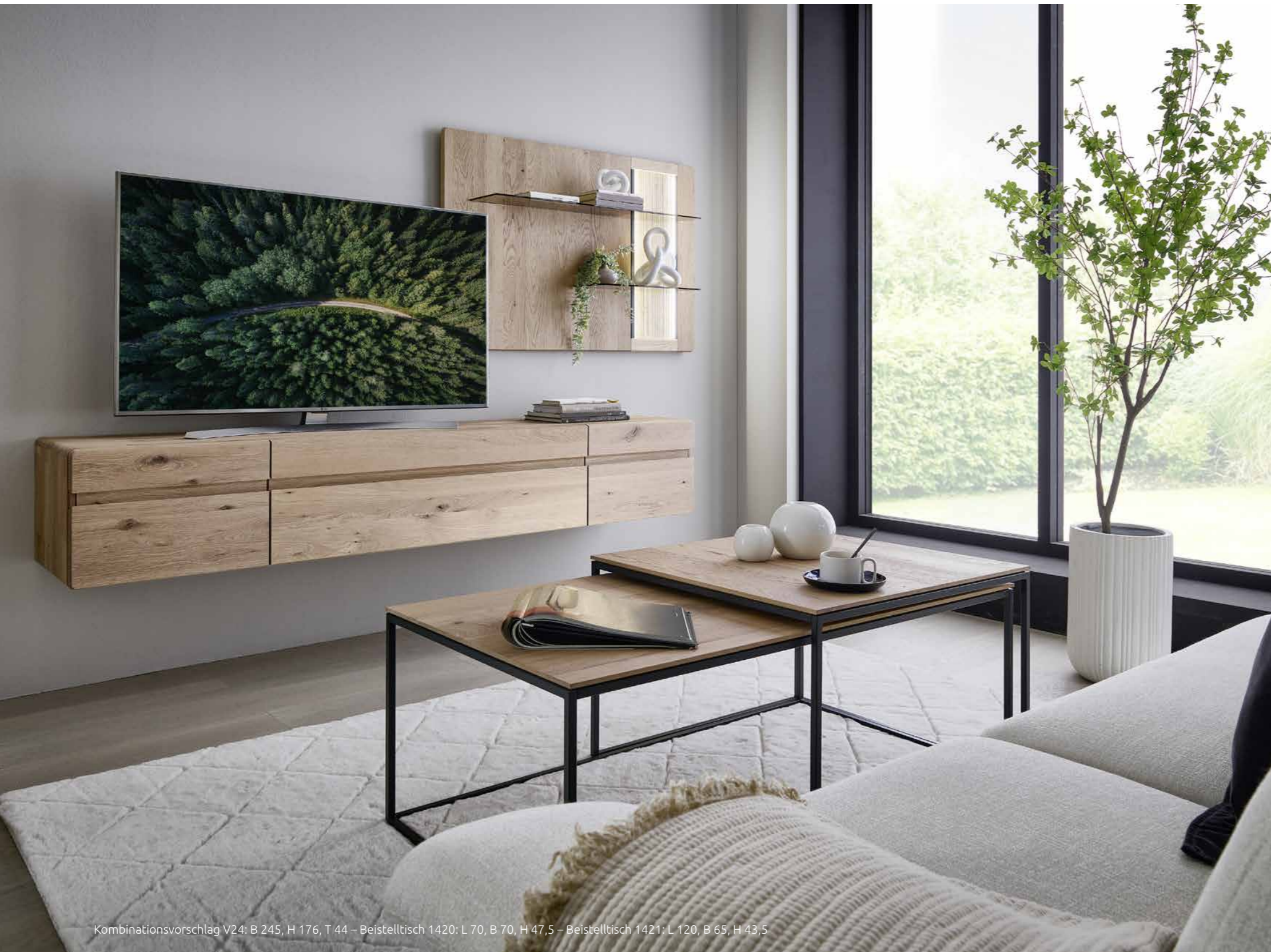
Kombinationsvorschlag V24: B 245, H 176, T 44 – Beistelltisch 1420: L 70, B 70, H 47,5 – Beistelltisch 1421: L 120, B 65, H 43,5