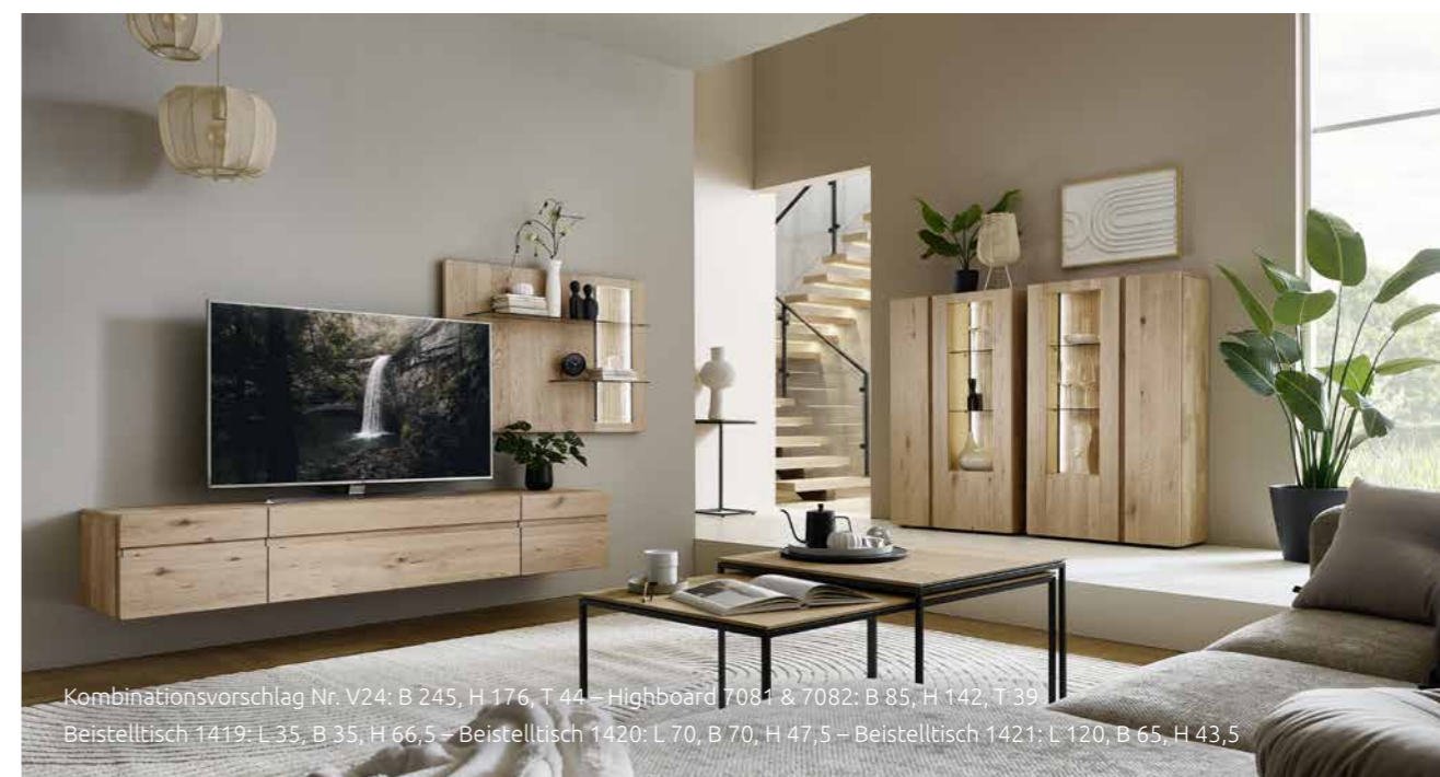
Kombinationsvorschlag Nr. V24: B 245, H 176, T 44 – Highboard 7081 & 7082: B 85, H 142, T 39 Beistelltisch 1419: L 35, B 35, H 66,5 – Beistelltisch 1420: L 70, B 70, H 47,5 – Beistelltisch 1421: L 120, B 65, H 43,5

Perfection is only what perfectly matches your vision. As a modular living system, Vida gives you complete freedom to create your dream home. Many cabinet units and panels are also available in mirrored configurations, ensuring endless possibilities and personal expression without limits.