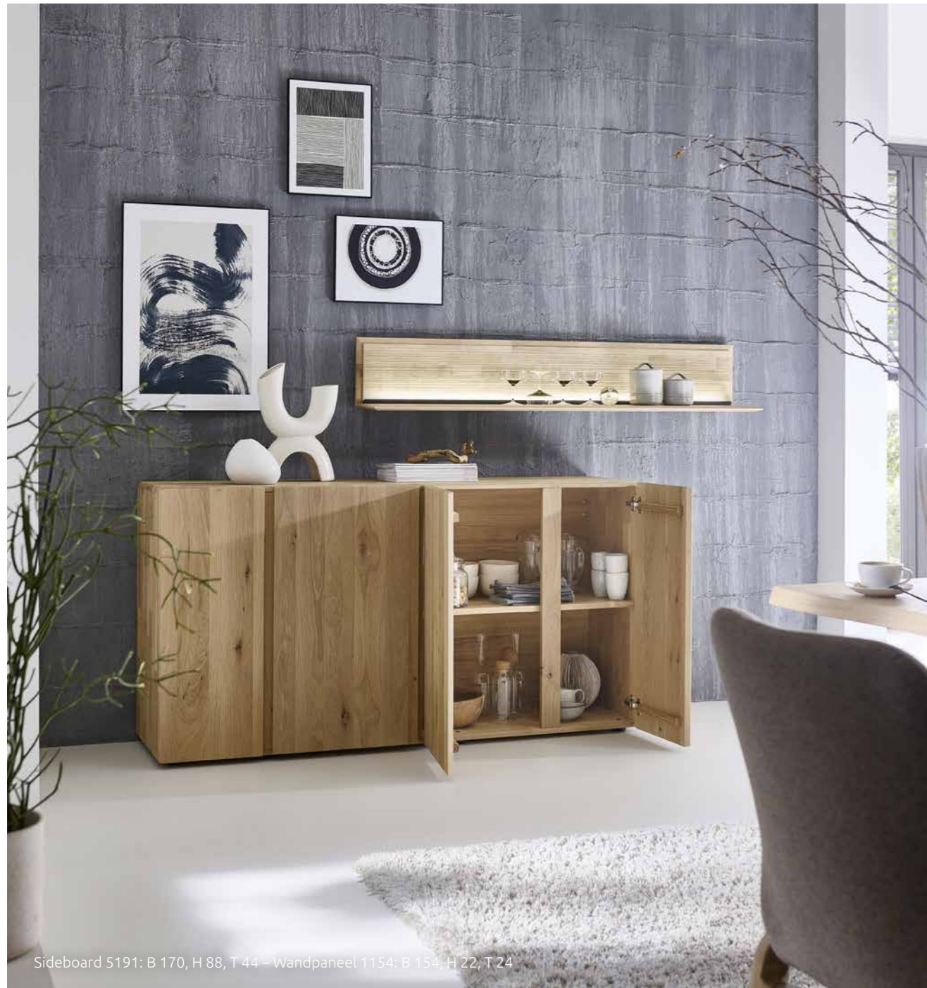
Sideboard 5191: B 170, H 88, T 44 – Wandpaneel 1154: B 154, H 22, T 24