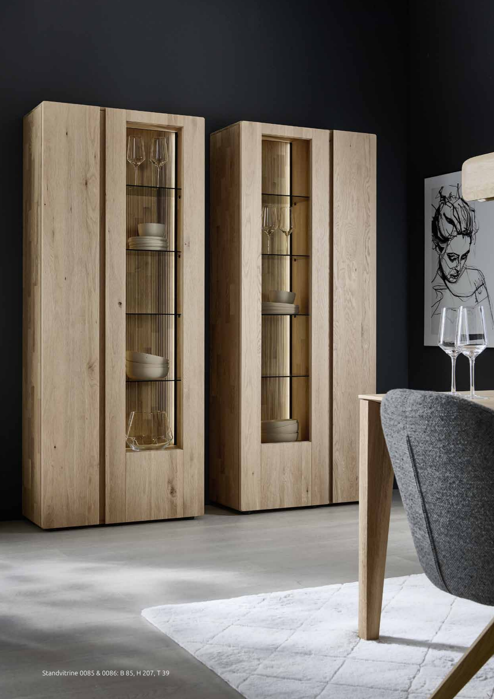
Standvitrine 0085 &amp; 0086: B 85, H 207, T 39